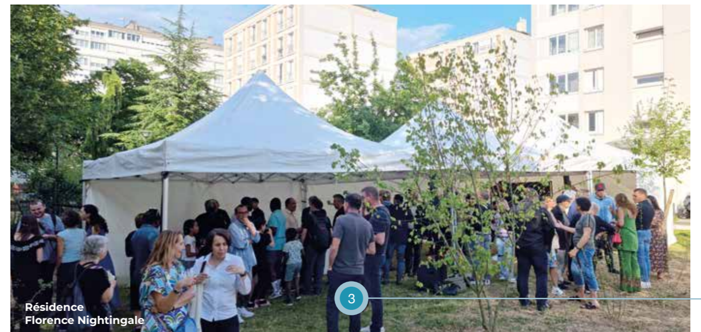
Résidence Florence Nightingale

Les habitants de l'immeuble et les parents des enfants gardés à la crèche (parfois les deux) avaient tous été conviés. Suite aux prises de parole, une visite guidée de la crèche Helen Keller a été proposée aux invités, contribuant à faire de cet événement une réussite et un temps chaleureux.